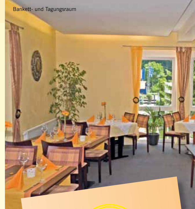
Bankett- und Tagungsraum