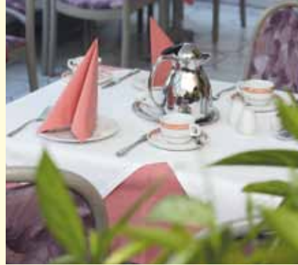
Frühstück im Wintergarten