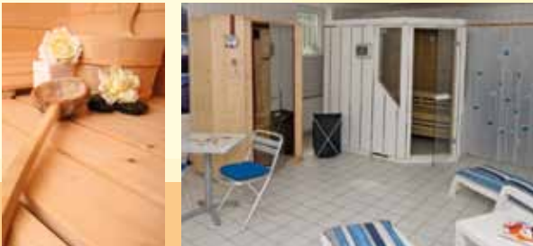
Ruhezone im Untergeschoß